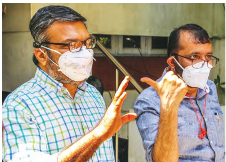
ഇനി ഞാനല്ല... ഇദ്ദേഹം...! തിരുവനന്തപുരത്ത് എക്കെജി സെന്ററിൽ ചേർന്ന സിപിഎം സംസ്ഥാന കമ്മിറ്റി യോഗത്തിൽ നിന്നു പുറത്തിറങ്ങിയ നിലവിലെ നിയമസഭാ സ്പീക്കർ പി. ശ്രീരാമകൃഷ്ണനെ നോക്കി ചിറ്റൂർ സ്പീക്കർ സാന്നിധ്യം എം.ബി. രാജേഷ്.